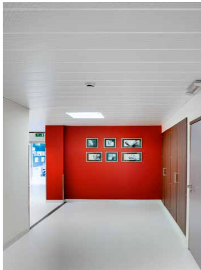
XL-plafond, zelfdragend op het Omega-bandraster. Dankzij het unieke Omega Hook ophangstelsel kunt u een zelfdragend XL-plafond voor ruimtes tot drie meter breed voorzien. Dit brandstabile stalen LCC-plafond is daarom zeer geliefd in gangen.

Praktische toepasbaarheid is een ding; het oog wil ook wat. Bij LCC heeft u een uitgebreide keuze uit paneelbreedtes naar gelang de ruimte waarvoor u ze nodig heeft. Ook als u verschillende panelen binnen eenzelfde gamma combineert, heeft u nog altijd een egaal plafondbeeld als resultaat. Bovendien zijn onze panelen eenvoudig aan te passen: een groot voordeel in ruimtes met een onregelmatige vorm.