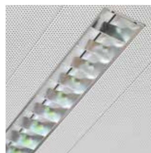
Verlichting, verluchting, branddetectie, sprinklers enz. worden naadloos verwerkt in elk LCC-plafond.